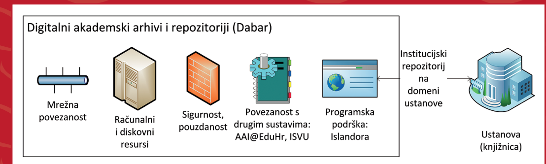
Elementi Dabra dostupni svakom od repozitorija u sustavu