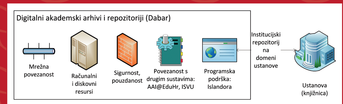
Elementi Dabra dostupni svakom od repozitorija u sustavu