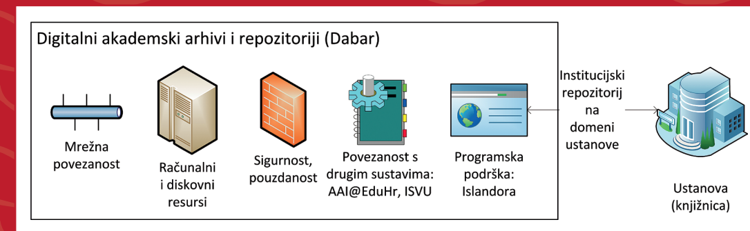
Elementi Dabra dostupni svakom od repozitorija u sustavu